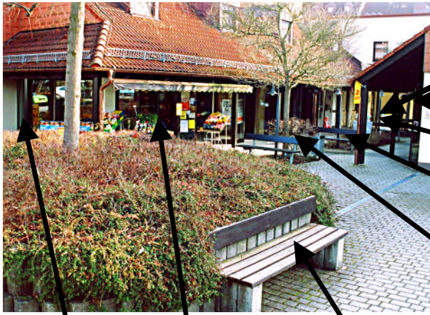
Bank 1 Bank 2 Bank 3